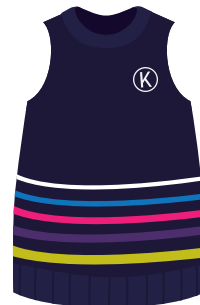
*Opcional (Niñ@s) Chaleco Institucional *También se puede usar en el uniforme de deportes