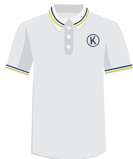
(Niñ@s) Playera polo Institucional