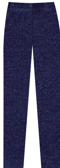
(Niñ@s) Pantalón de mezclilla color azul marino *Sin estampados, decoloraciones o roturas