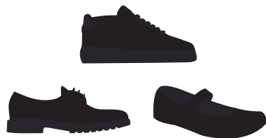
(Niñ@s) Zapato escolar o tenis color negro *Diseño libre