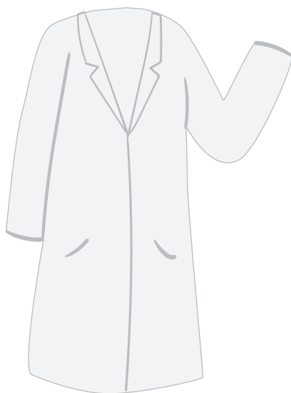
(Alumn@s) Bata blanca únicamente para ingresar al laboratorio