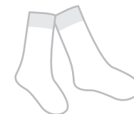
(Niñ@s) Tines o calcetas color blanco