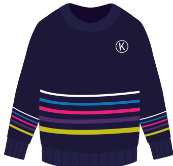
(Niñ@s) Suéter Institucional *También se puede usar en el uniforme de deportes