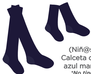
(Niñ@s) Calceta color azul marino *No tines