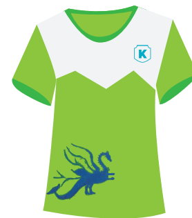
(Alumn@s) Playera deportiva Institucional