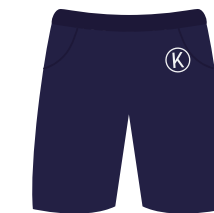
(Niñ@s) Pants o short color azul marino Institucional