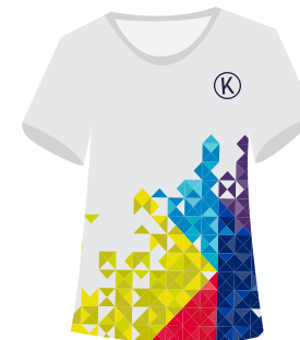
(Niñ@s) Playera deportiva Institucional