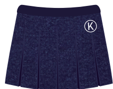
*Opcional (Niñas) Falda Institucional *Maternal no lleva falda