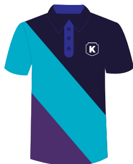
(Alumn@s) Playera polo Institucional