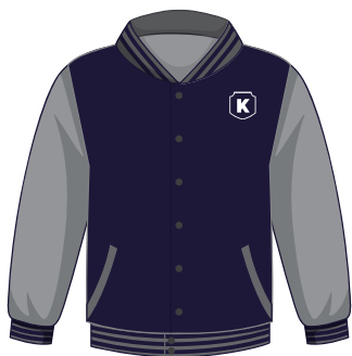
*Opcional (Alumn@s) Chamarra Institucional