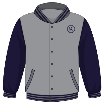
(Niñ@s) Chamarra Institucional *También se puede usar en el uniforme de deportes