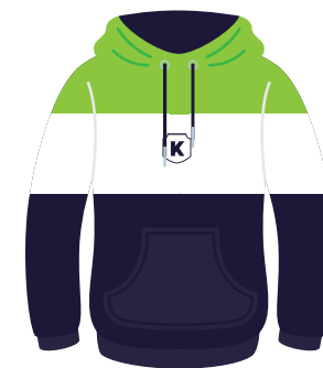
*Opcional (Alumn@s) Sudadera Institucional *También se puede usar en el uniforme de diario.